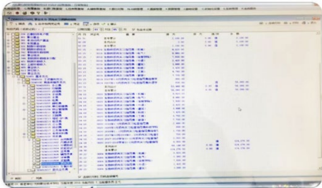
图7 学校设立岗位实习专项经费

(5) 建立经费保障机制，确保满足需要、支出有据、合规使用。出台实习经费管理制度，设立专项经费，做到有据可依。明确学校统筹和院系实习经费标准、支出范围和报销程序，财务处、实训处监督和审核经费使用情况。