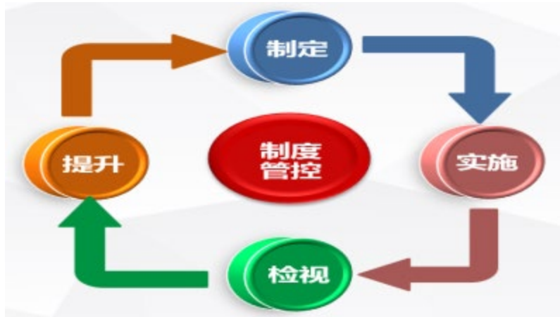
图 5 制度管控 PDCA 循环

年（正在进行）四次全面制（修）订 19 项管理制度及 27 项管理模板，从制度层面明确教学任务、组织流程、执行标准、行为规范、考核评价、安全职责、保障措施、监督管理等内容。通过反复执行 PDCA 循环，形成一套全面完善、行之有效的实习管理制度体系。