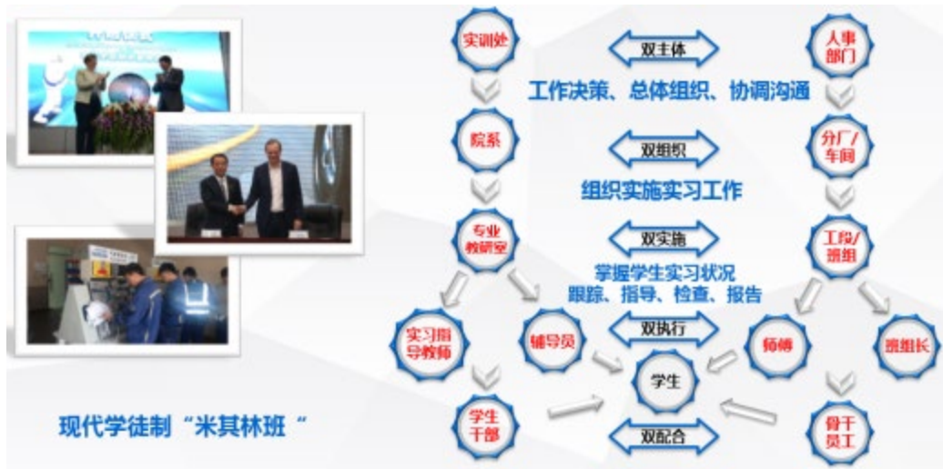
图2 校企“五层级”双线并行融合管理