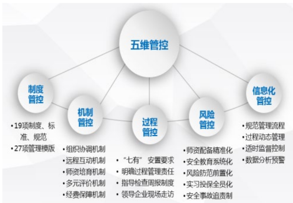
图4 实施“五管控”实现“三全”管理