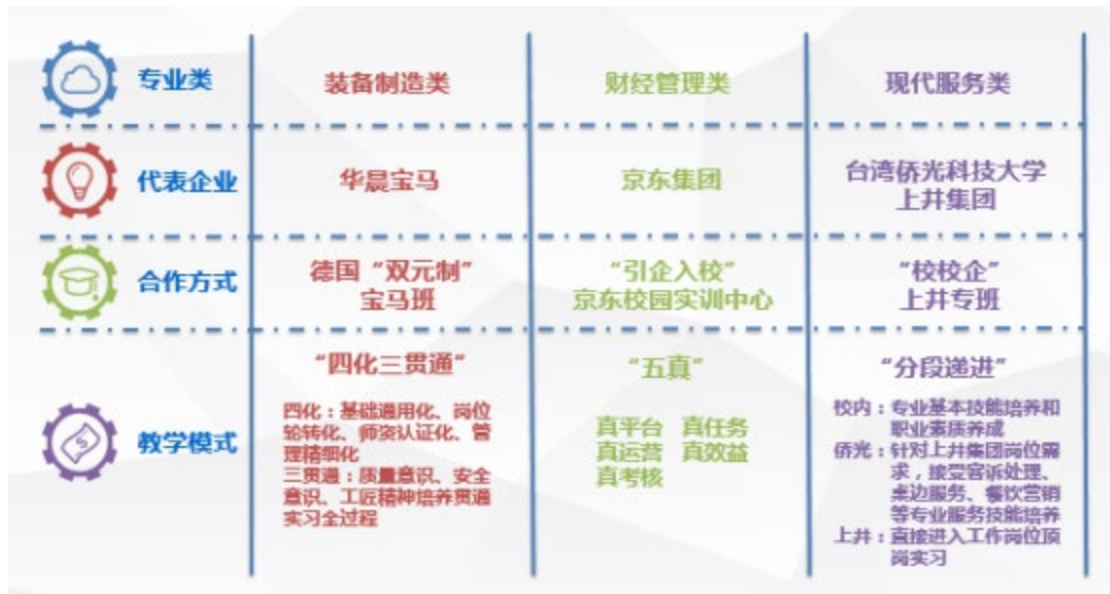
图3 岗位实习“三模式”教学改革

成实习；在侨光科技大学接受上井集团企业文化、客诉处理、桌边服务、餐饮营销等专业服务技能实习；在上井集团直接进入岗位轮转实习。